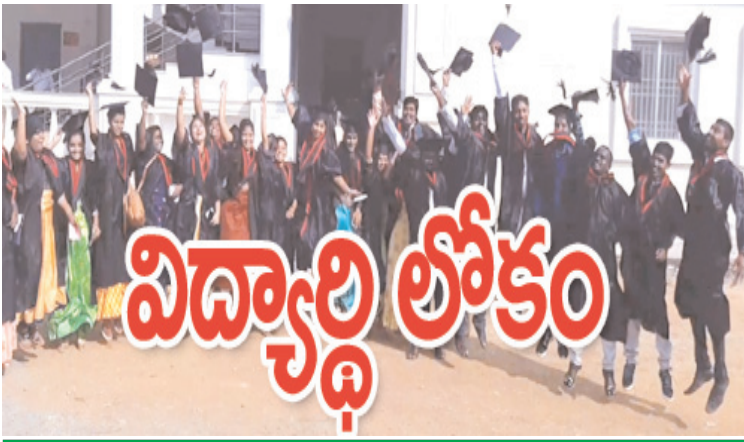
నూతన విద్యా సంవత్సరం ప్రారంభం.. నన్నయలో విద్యార్థుల సందడి